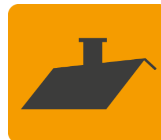
Dach lub strop