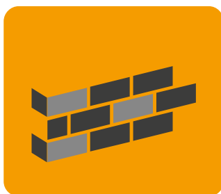
Ściany zewnętrzne oraz wewnętrzne, oddzielające pomieszczenia ogrzewane od nieogrzewanych