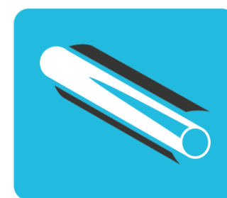
Centralne ogrzewanie i ciepła woda użytkowa