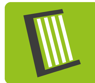
OZE: mikroinstalacje fotowoltaiczne i kolektory słoneczne