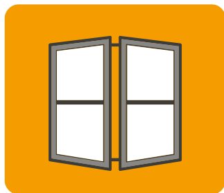
Stolarka okienna i drzwiowa